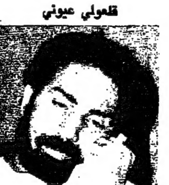
محمود شهادات في لقطات من مسرحية قلعوي عيونى